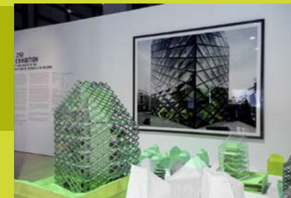
Expositie - impressie.