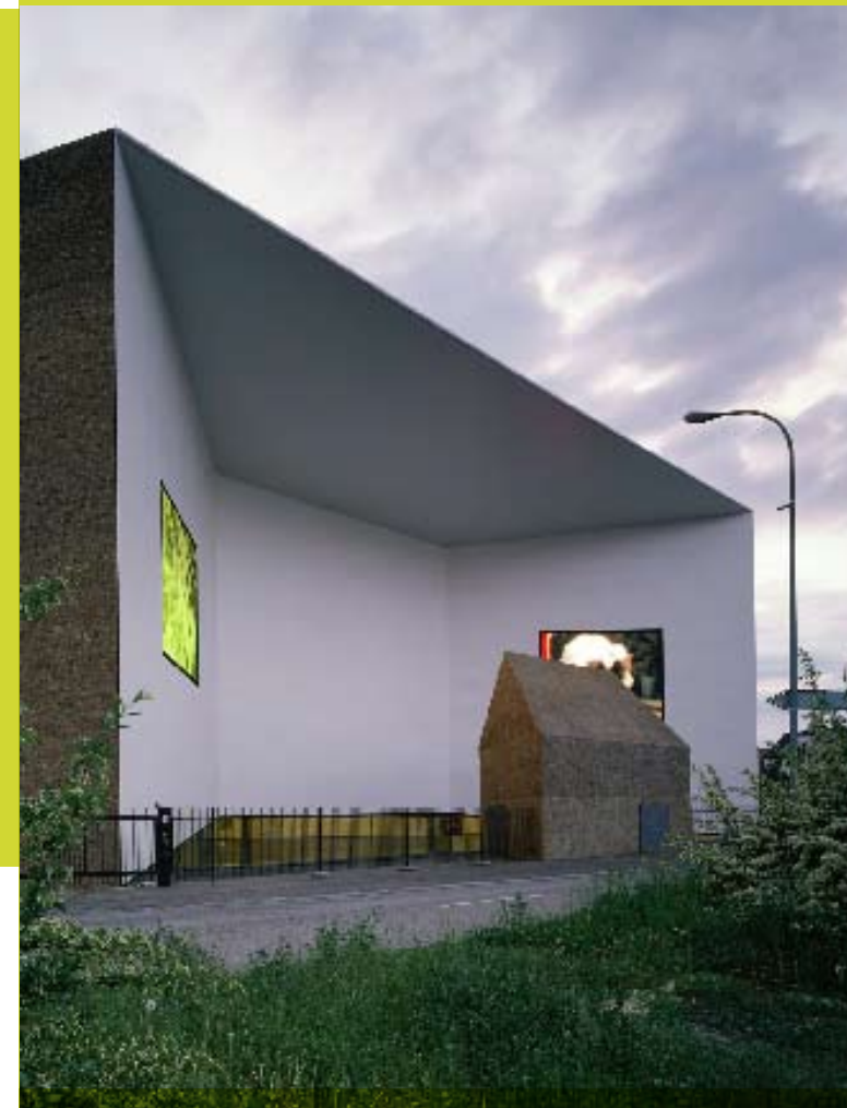
Schaulager in Basel, Zwitserland.

'Waarom ik architect ben geworden? Ik hield van kunst en taal maar studeerde ook natuurkunde, wetenschap, chemie. Architectuur is een brouwsel van al die elementen. Het vereist niet alleen visuele vaardigheden. Wij proberen diverse zintuigen te beroeren. Willen een architectuur bereiken die niet leesbaar is zoals je een boek leest, maar niettemin een aantrekkingskracht op de mensen uitoefent. Als ik nu uit het raam kijk, zie ik museum Boymans van Beuningen: een aantrekkelijk gebouw, maar waarom precies kan ik niet aangeven. Dat is instinctieve architectuur. In de globale wereld kun je architectuur niet baseren op een educatieve achtergrond, waarbij je de geschiedenis van de bouwkunst moet kennen om een gebouw te begrijpen. Het zijn referenties en citaten, maar