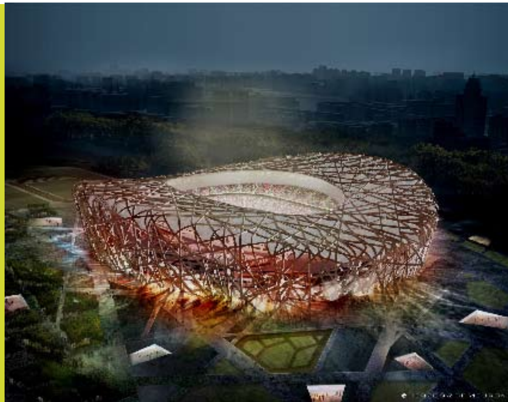
Artist impression van het Olympisch Stadion in Beijing, China.

Waag niet te zeggen dat parfum en architectuur niet samengaan. 'Twintig jaar geleden waren wij al gefascineerd door het vervaardigen van geur', zegt Jacques Herzog opgewekt. Voor het publiciteitsrondeje in het NAI, waar hij aan een tafel in de grote tentoonstellingsruimte om de beurt een journalist te woord staat, heeft hij zijn wat minder sociale partner Pierre de Meuron thuisgelaten. Aan het parfum kleef een boodschap: 'We leven in een visuele cultuur. Architectuur zou meer moeten zijn dan alleen het visuele aspect. Bouwen draagt ook auditieve, geur- en smaakgerelateerde zaken in zich. Geuren maken deel uit van de wereld van architectuur. Iedere zichzelf respecterende couturier brengt een eigen geurlijn uit. Waarom wij dan niet? Een geur herinnert je aan iets uit het verleden. Architectuur moet net als mode meer glamour krijgen.'