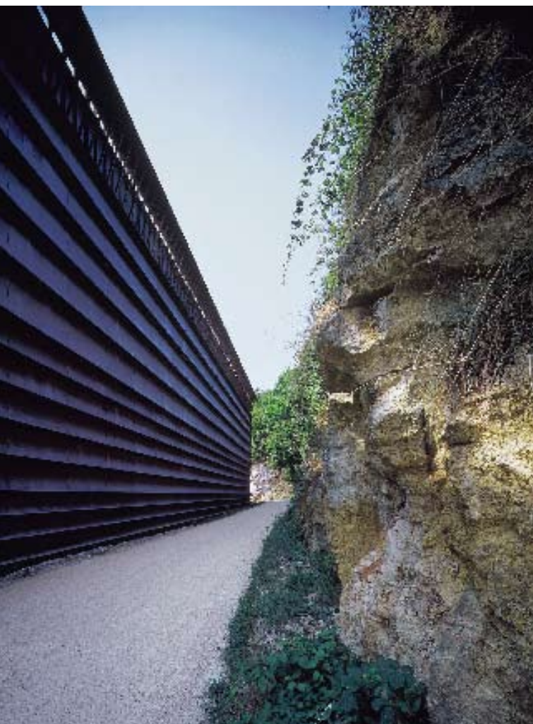
Opslaggebouw van Ricola in Basel, Zwitserland door Herzog & De Meuron.

‘Architectuur is een mijnenveld’, beweert Jacques Herzog (54). ‘Je verzet bergen werk en verbruikt miljoenen om onze steden en landschappen te ensceneren. Het is een gebied waar je veel talenten kunt ontplooien, een fantastische kans om landen en hun culturen te begrijpen. Daarom zijn onze gebouwen zo verschillend, en kun je ons niet vastpinnen op één stijl: we hebben op onze continue trip rond de wereld een exploreerdrang en een niet aflatende nieuwsgierigheid ontwikkeld, die we koste wat kost willen behouden.’