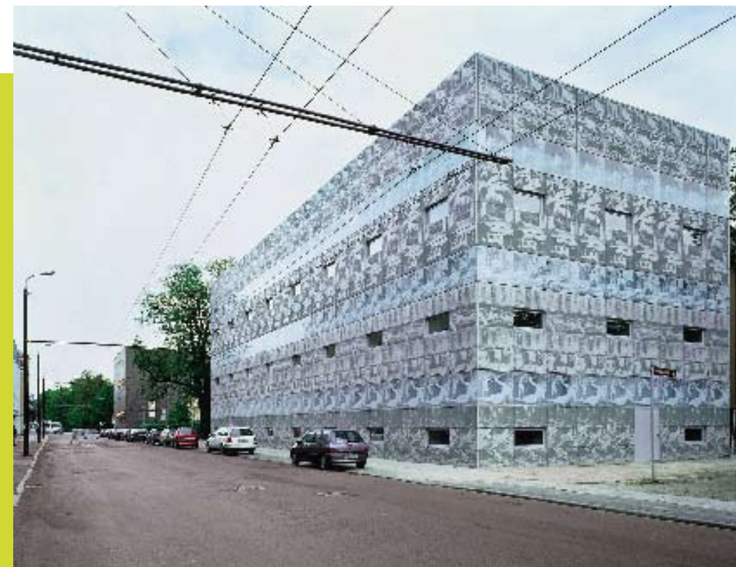
Bibliotheek in Eberswalde, Duitsland door Herzog &amp; De Meuron.

Dat bouwkunst in de laatste vijf, tien jaar veel veranderingen heeft ondergaan, beaamt Herzog hartgrondig. 'De positie van de architect is veel prominenter geworden. Tezelfdertijd is de middenklasse-goede-stijlarchitectuur bijna verdwenen. Enkele pronkstukken zijn op de voorgrond gezet, om steden of architecten zelf van een merk te voorzien.'